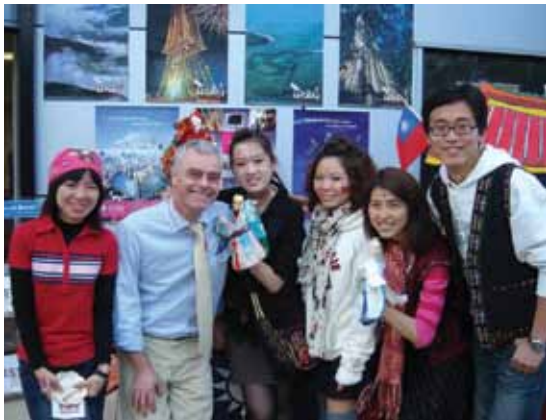
(Сян справа, с сотрудниками и бывшими сокурсниками на Международной неделе ABS)

Магистр естественных наук, организация и управление материально-техническим снабжением Специалист по планированию логистической цепочки, NXP Semiconductors